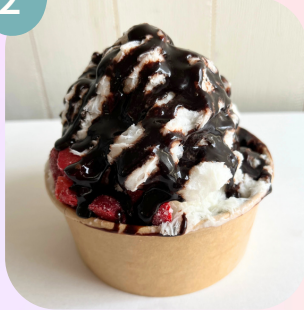
イチゴ & チョコソース