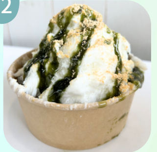
きなこ & 抹茶