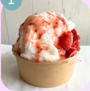
イチゴ & ストロベリーソース