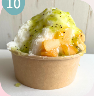
マンゴー & キウイソース