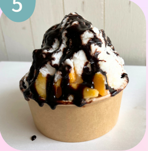
マンゴー & チョコソース