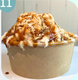
きなこ & 黒みつ