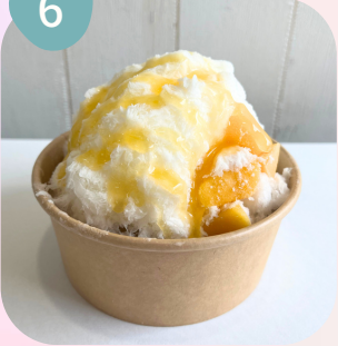
マンゴー & マンゴーソース