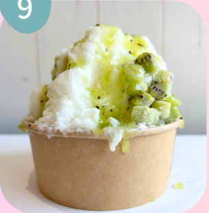
キウイ & キウイソース