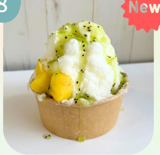
パイン & キウイソース