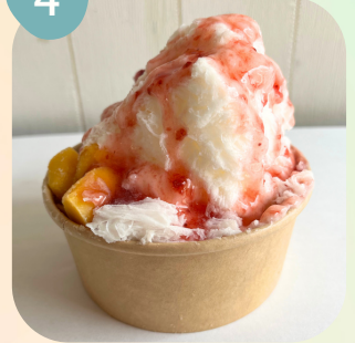
マンゴー & ストロベリーソース