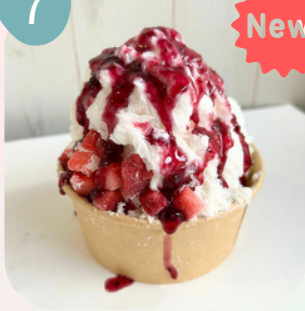
ストロベリー & ブルーベリーソース