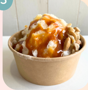
ナッツ & キャラメルソース