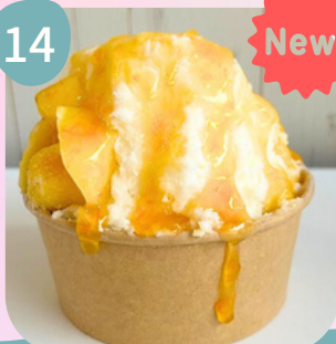
パイン & オレンジソース