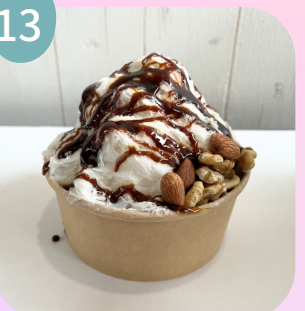
ナッツ & コーヒーソース